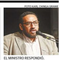
EL MINISTRO RESPONDIÓ.

Frutas de Chile y Senadores Provoste y Prohens buscan coordinar acciones para avanzar en una solución a la implementación del Systems Approach para los envíos de uvas chilenas a EEUU