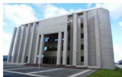
Proyecto: Diseño Ampliación ICA Temuco Subproyectos: no aplica Fecha estimada de término : 2° semestre 2023 Inversión 2023 : M$ 35.079 Inversión Total : M$ 47.299