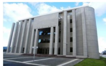
Proyecto: Diseño Ampliación ICA Temuco Subproyectos: no aplica Fecha estimada de término : 2° semestre 2023 Inversión 2023 : M$ 35.079 Inversión Total : M$ 47.299