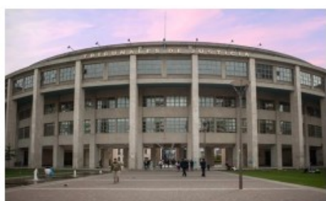
Proyecto: Conservación Tribunales Administración Zonal Concepción Subproyectos: ICA de Concepción y otros Fecha estimada de término : 2° semestre 2023 Inversión 2023 : M$ 1.110.555 Inversión Total : M$ 4.713.232