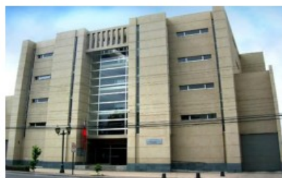
Proyecto: Conservación Varios Tribunales Subproyectos: JG y TJOP de Rancagua y otros Fecha estimada de término : 2° semestre 2023 Inversión 2023 : M$ 331.656 Inversión Total : M$ 2.967.723