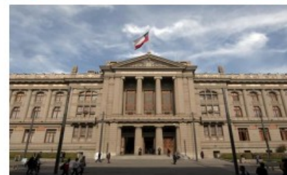
Proyecto: Conservación Palacio de Tribunales, Santiago Subproyectos: no aplica Fecha estimada de término : 2° semestre 2023 Inversión 2023 : M$ 260.693 Inversión Total : M$ 6.494.277