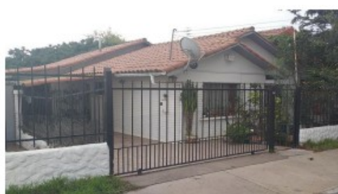
Proyecto: Conservación Viviendas Judiciales Subproyectos: no aplica Fecha estimada de término : 2° semestre 2023 Inversión 2023 : M$ 265.750 Inversión Total : M$ 3.117.190