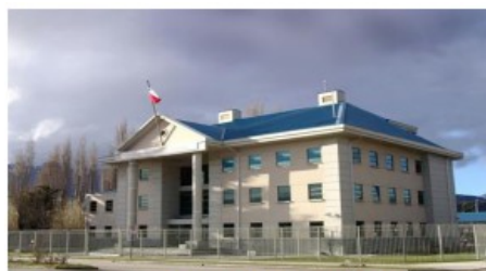
Proyecto: Conservación Juzgados Región de Aysén Subproyectos: ICA Coyhaique y otros Fecha estimada de término : 2° semestre 2023 Monto estimado de inversión : M$ 383.573 Inversión Total : M$ 784.507