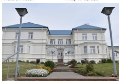
Proyecto: Conservación Juzgados Punta Arenas Subproyectos: ICA de Punta Arenas y otros Fecha estimada de término : 2° semestre 2023 Inversión 2023 : M$ 64.266 Inversión Total : M$ 265.536