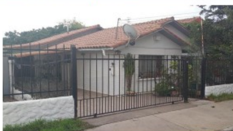
Proyecto: Conservación Viviendas Judiciales Subproyectos: no aplica Fecha estimada de término : 2° semestre 2023 Inversión 2023 : M$ 265.750 Inversión Total : M$ 3.117.190