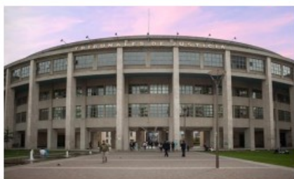
Proyecto: Conservación Tribunales Administración Zonal Concepción Subproyectos: ICA de Concepción y otros Fecha estimada de término : 2° semestre 2023 Inversión 2023 : M$ 1.110.555 Inversión Total : M$ 4.713.232

PODER JUDICIAL AL SERVICIO DE TODAS LAS PERSONAS