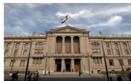
Proyecto: Conservación Palacio de Tribunales, Santiago Subproyectos: no aplica Fecha estimada de término : 2° semestre 2023 Inversión 2023 : M$ 260.693 Inversión Total : M$ 6.494.277