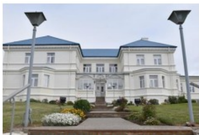
Proyecto: Conservación Juzgados Punta Arenas Subproyectos: ICA de Punta Arenas y otros Fecha estimada de término : 2° semestre 2023 Inversión 2023 : M$ 64.266 Inversión Total : M$ 265.536