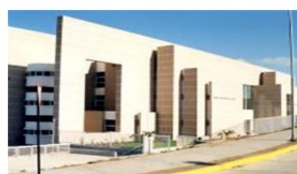
Proyecto: Conservación Juzgados Región de Coquimbo Subproyecto: TJOP La Serena y otros Fecha estimada de término : 2° semestre 2023 Monto estimado de inversión : M$ 115.728 Inversión Total : M$ 462.102

Por último, se refirió a ciertos aspectos que consideró importante exponer, en caso de que surjan necesidades no financiadas durante el año 2023.