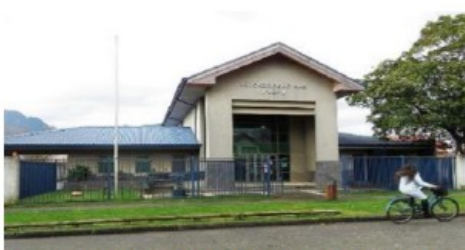
Proyecto: Diseño Ampliación Juzgado Letras y Garantía de Pucón Subproyectos: no aplica Fecha estimada de término : 2° semestre 2023 Monto estimado de inversión : M$ 32.846 Inversión Total : M$ 44.875