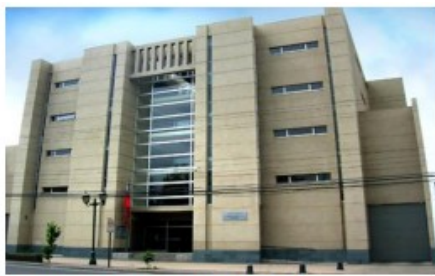
Proyecto: Conservación Varios Tribunales Subproyectos: JG y TJOP de Rancagua y otros Fecha estimada de término : 2° semestre 2023 Inversión 2023 : M$ 331.656 Inversión Total : M$ 2.967.723