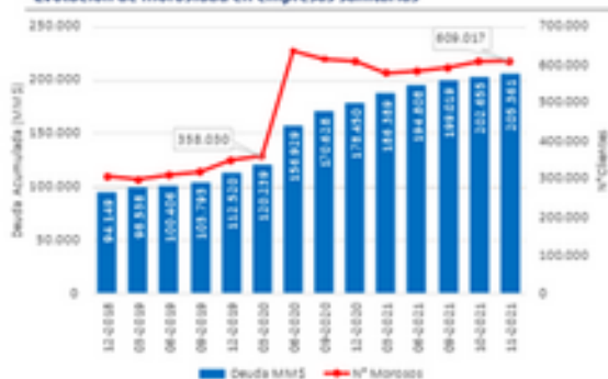
Evolución de morosidad en empresas sanitarias