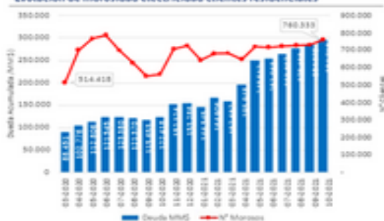
Evolución de morosidad electricidad clientes residenciales