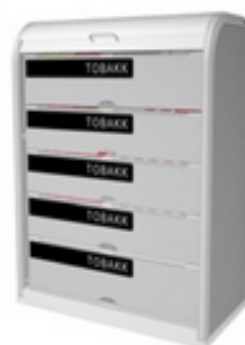
Shelves with flaps

Sitio web: www.chilelibredetabaco.cl Correo: redchilelibredetabaco@gmail.com Tels: (56-2) 548-6021 y 548-7617 (Fundación EPES) Santiago, Chile