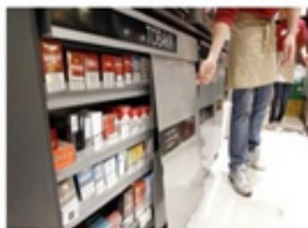
Cabinets with doors