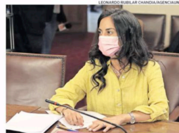
NÚÑEZ INSTÓ AL GOBIERNO A “TOMAR DECISIONES”.

Más abajo se refirieron al “aumento de encerronas y portonazos”, así como cuáles serán las medidas para “devolver la tranquilidad a los vecinos de