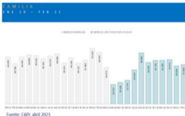
Fuente: CAPI, abril 2021.