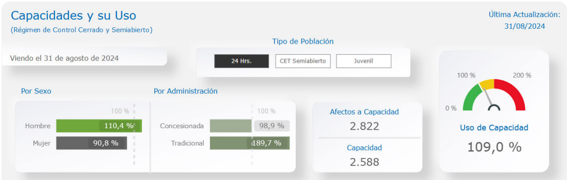
Figura 7: Capacidades y uso de los establecimientos según su diseño

Al hacer una revisión de la población reclusa en el régimen de 24 horas en la región, al 31 de agosto, se aprecia que: i) el uso de capacidad general de la región es de 109%, donde la capacidad de la población reclusa es superada en 234 personas, como se ve en la figura 7; ii) lo anterior ubica a la región en el puesto 11 del país en cuanto a ocupación penitenciaria, como se puede apreciar en la figura 8; iii) asimismo, la tasa de ocupación de hombres es mayor a la de mujeres en un 19,6%, como es apreciable en la figura 7; iv) por último, y según el tipo de administración, los establecimientos tradicionales se encuentran con mayor uso de su capacidad que los concesionados en un 90,8% (ver figura 7).