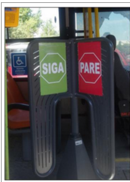
Torniquete en buses mediciones en terreno

- Próxima empresa a implementar piloto con instalación de torniquete en 25 buses.