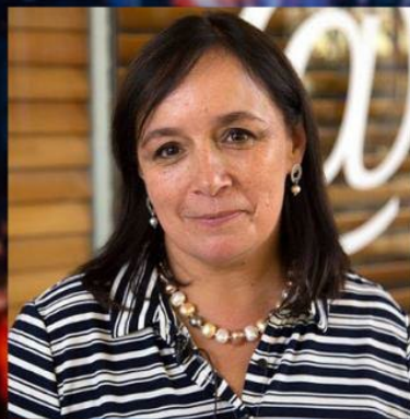
Senadora Carmen Gloria Aravena