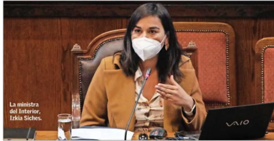
La ministra del Interior, Izkia Siches.