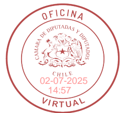
FIRMADO DIGITALMENTE: H.D. JAIME ARAYA G.