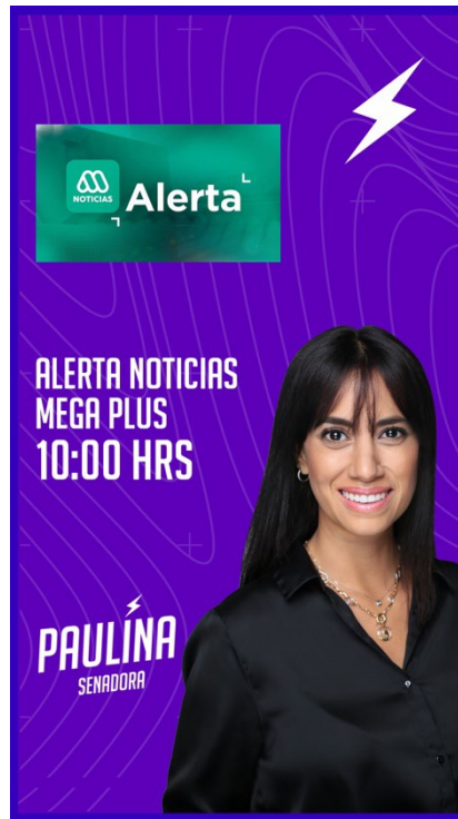
RECORTES DE PRENSA (Historias)