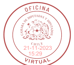
ANA MARIA BRAVO Diputada de la República

Serán solidariamente responsables en caso de incumplimiento de las obligaciones descritas en los incisos anteriores, los establecimientos educacionales, las municipalidades o cualquier sostenedor que entregue servicios de transportes escolar.