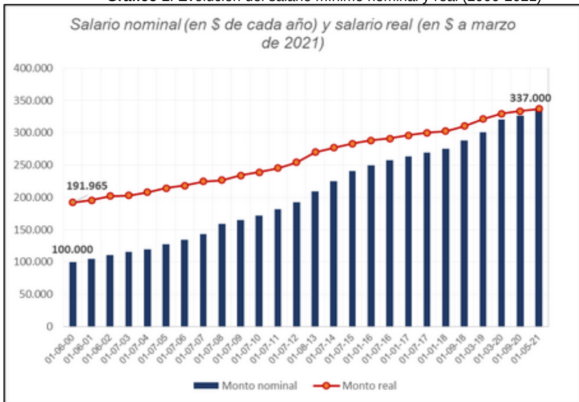
Gráfico 1: Evolución del salario mínimo nominal y real (2000-2021)

Fuente: Elaboración propia en base a datos del Banco Central de Chile