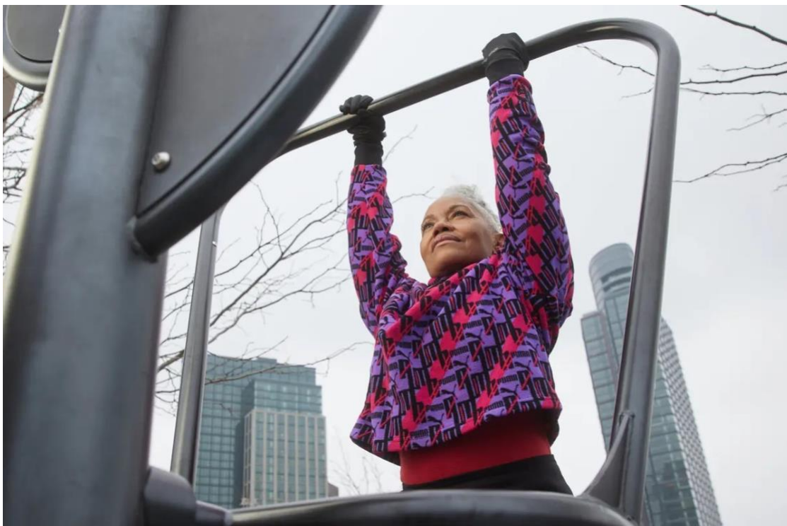
Sansone for The New York Times

Cuando somos jóvenes, el ejercicio nos permite correr una carrera después de trasnochar o surfear en la nieve con una dieta a base de Doritos. Pero a medida que envejecemos, estar en forma se vuelve mucho más importante, ya que aumenta nuestros niveles de energía, previene lesiones y mantiene ágil nuestra mente.