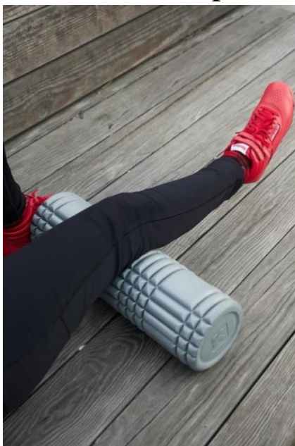
Fotografía de primer plano de la pierna de una mujer sobre un rodillo de espuma cilíndrico debajo de la rodilla.